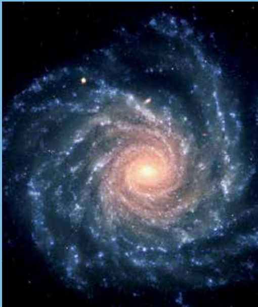
Die Spiralgalaxie NGC 1232, deren Milliarden von Sternen wie Nebel erscheinen.

Astrophysik – eine Sternstunde zu Wissen und Glauben