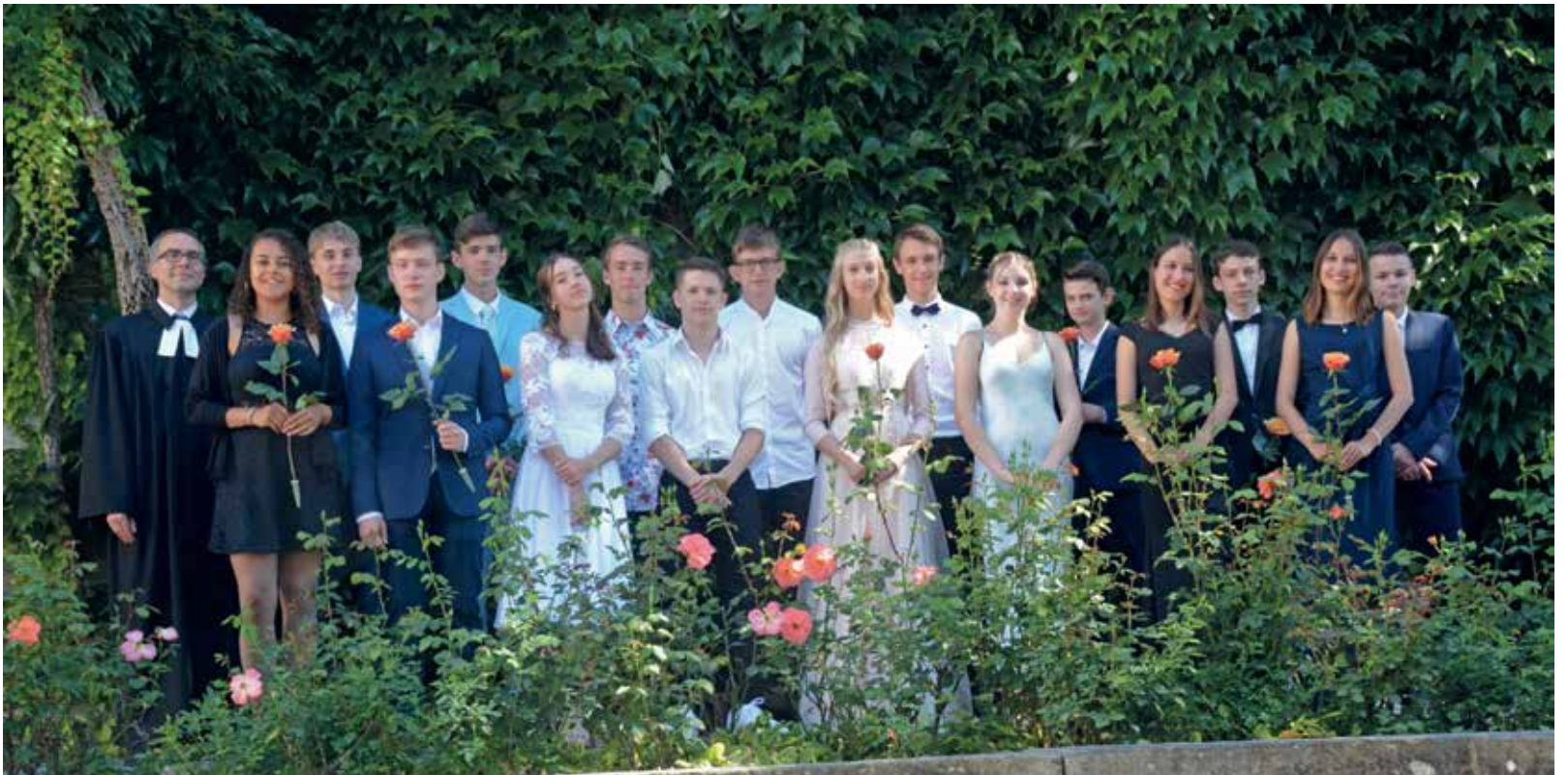
Neun Konfirmandinnen und Konfirmanden feierten am 5. Juli, sieben am 12. Juli 2020 mit ihren Familien Konfirmation in der reformierten Kirche Eglisau.