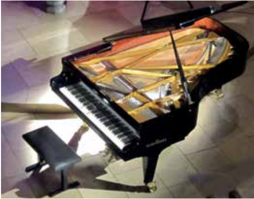
Offener Flügel in der reformierten Kirche Eglisau

Freitag, 18. September 2020, 19.30 Uhr, Spätsommerkonzert in der ref. Kirche mit Duke Trio; Piano, Violine, Cello