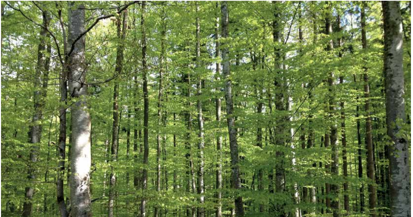
Blick in den Buchenwald. Buchen werden 80-jährig, bis sie erwachsen und geschlechtsreif sind.