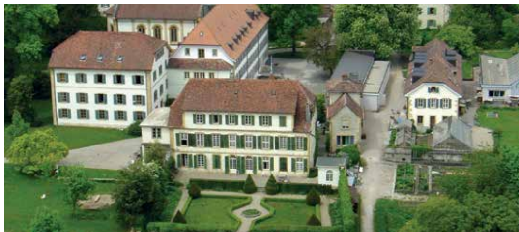
Communität Don Camillo Montmirail in Thielle-Wavre / NE