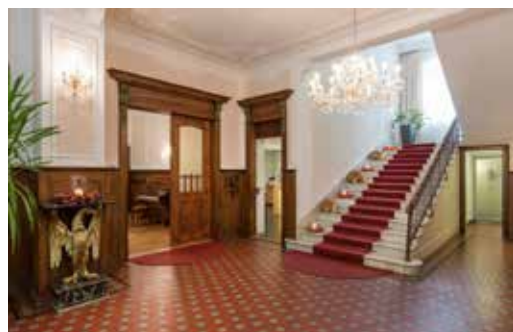
Grosszügiges Treppenhaus, antike Wohnstube und Jugendstil-Speisesaal erinnern an die Belle Epoque