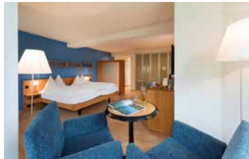
Gemütliches Doppelzimmer im Albergo Fravi

Die Kosten betragen inklusive Reise im Car und Vollpension im Einzelzimmer ca. Fr. 1200 und im Doppelzimmer ca. Fr. 1100.-, dazu kommen Kosten für optionale Ausflüge Personen, für welche die Finanzierung ein Hinderungsgrund ist, können sich gerne bei Monika Strobel melden.