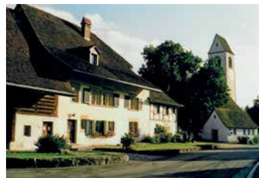
Evang.-ref. Kirche und Pfarramt Niederbipp / BE