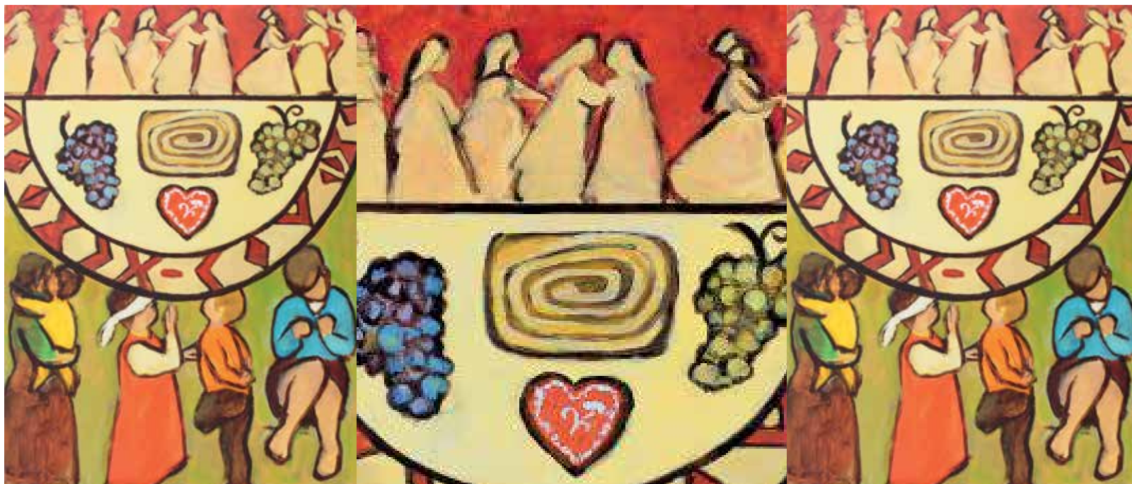
Zum Weltgebetstag der Frauen 2019 aus Slowenien zum Thema «Kommt, alles ist bereit»