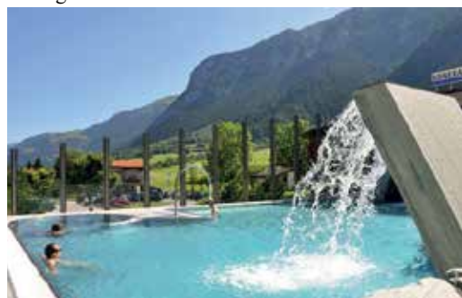
Das Mineralbad Andeer, eine ca. 1'800 m2 grosse Wellnessoase, ist direkt mit dem Hotel verbunden.