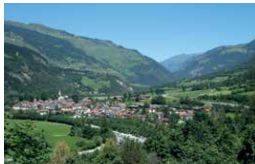
Andeer / GR liegt rund 1000 Meter über Meer.