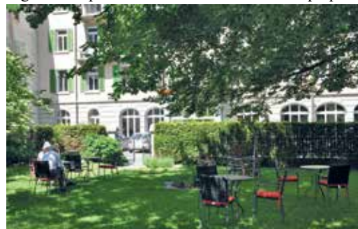
Die schöne Parkanlage lädt zum Verweilen ein.