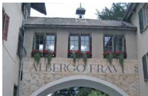
Willkommen im Bade-, Kur- und Ferienhotel Albergo Fravi in Andeer / GR.

Seniorinnen und Senioren geniessen in der Umgebung des malerischen Schamsertals Begegnungen mit Menschen, auch über unsere (Kirch-) Gemeindegrenzen hinweg, und mit Gott. Thematische Andachten und Inputs, Ausflüge und viel Zeit für Zusammensein und eigene Ideen sind Inhalte der Woche. Entspannung bietet auch das von unserem Hotel mit direktem Zugang verbundene Mineralbad Andeer.