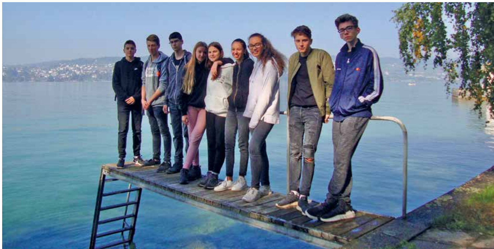
Foto aus dem Konf-Lager. Es fehlen darauf Pascal Haas und Lea Scherr.