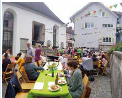
Gottesdienst im Chilehof Juni 2018