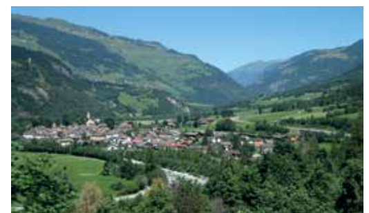
Andeer / GR liegt rund 1000 Meter über Meer.