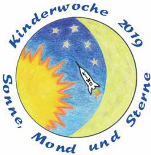
Logo Kinderwoche 2019: Familie Wälle

Alle Kinder vom 1. Kindergarten bis zur 5. Klasse sind herzlich eingeladen.