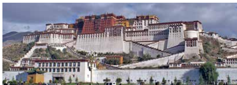
Potalapalast in Lhasa, Tibet. Mehr davon am Seniorenanlass am 8. Juni.