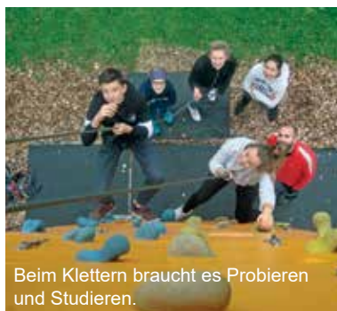
Beim Klettern braucht es Probieren und Studieren.