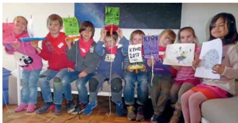
KiWo-Kinder mit ihren selbst gebastelten Segelbooten.

Herzlichen Dank allen, die diese fröhliche Woche ermöglicht haben! Fotos können auf unserer Website www.kircheeglisau.ch eingesehen werden. >Susanne Stadler