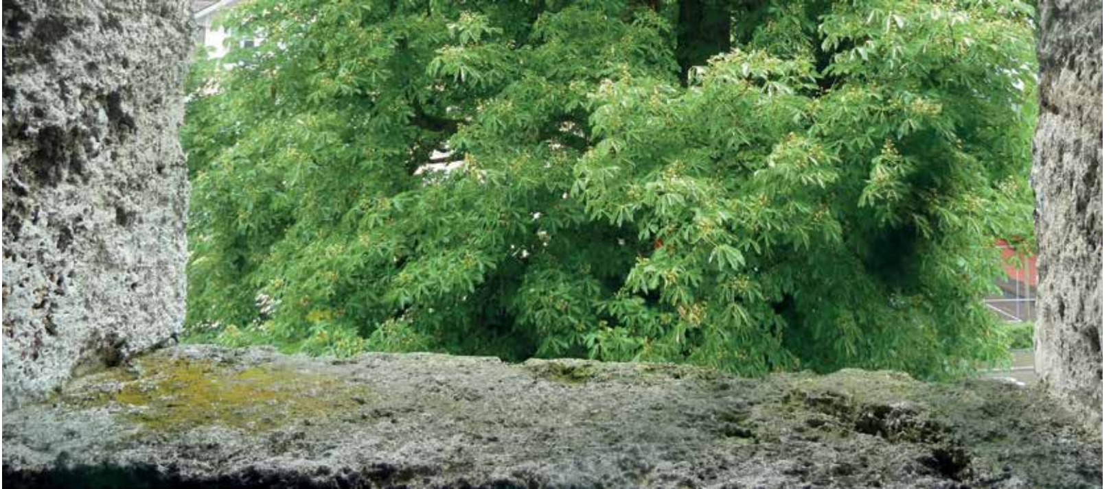
Blick aus dem um 1717 von Grund auf neu gebauten, dreissig Meter hohen, barocken Haubenturm mit seinen vier Uhrgiebeln.