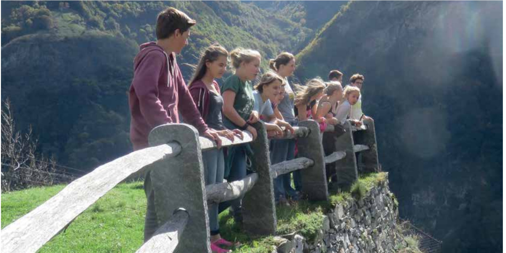
Ausblick ins Maggiatal. Konf-Lager im Herbst 2015.