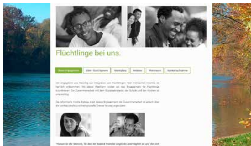
Abbildung der Homepage «www.fluechtlinge-eglisau.ch».