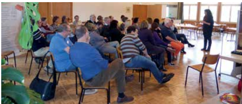
Kirchentagung in Hüntwangen

Unter Leitung einer Moderatorin befassten sie sich mit Möglichkeiten der regionalen Zusammenarbeit, und werden als erstes ein gemeinsames Projekt im Bereich der Jugendarbeit planen, sowie regelmässige regionale Treffen der jeweiligen Ressortverantwortlichen. Erste ermutigende Schritte auf einem längeren Weg.