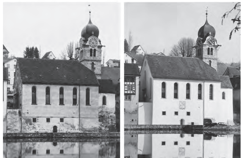
Aussenansicht von der letzten Renovation 1960, vorher / nachher.