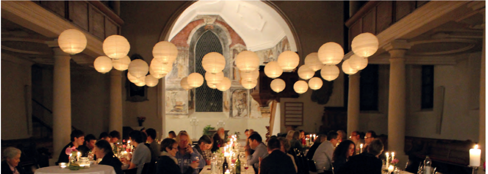
Freiwilligenanlass in der reformierten Kirche Eglisau vom 11. September 2015

Mehr Bilder dazu auf www.kircheeglisau.ch .