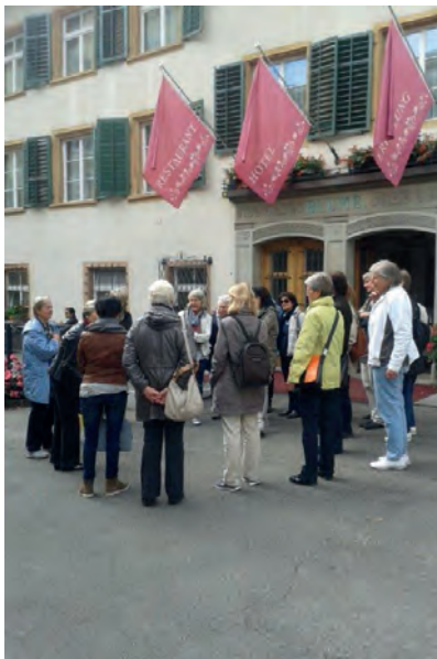
«Hotel Blume» Baden