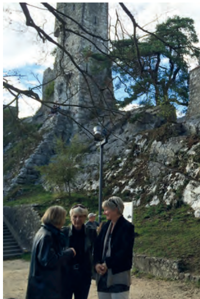
«Burgruine Stein» Baden