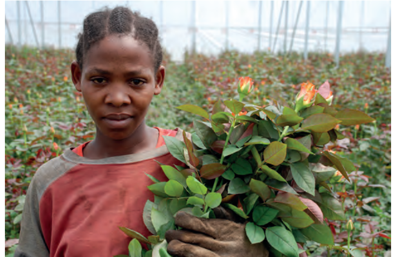
Rosenfarm in Tansania - Blumenarbeiterin Kiliflora